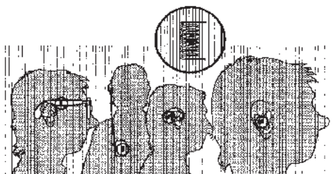
“Telespolens posisjon i magnetfeltet”

Bruk av et slyngesystem kan deles opp i to kategorier; lytting i hjemmet og lytting i offentlige miljøer. I hjemmemiljøet er det som oftest bare en bruker og installasjonen kan derfor tilpasses mer individuelt. Der kan installatøren passe på at denne personen får best mulige lytteforhold.